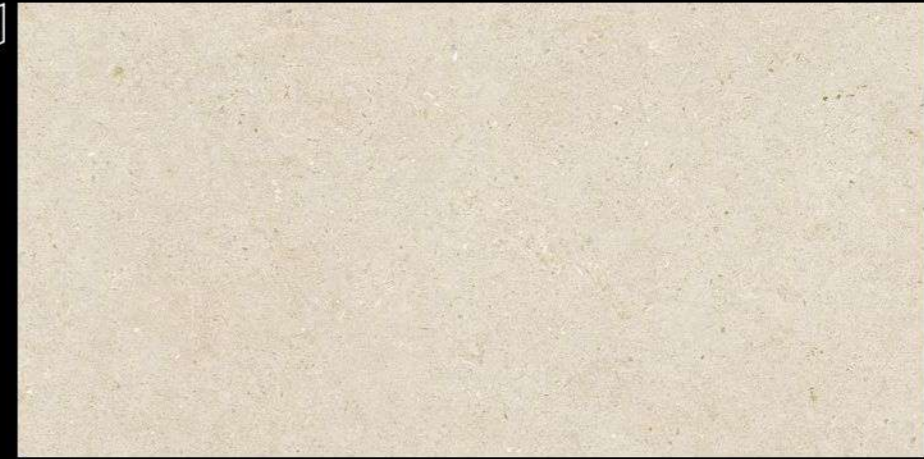
SOMPORT SAND 60x120 NATURAL ANTISLIP